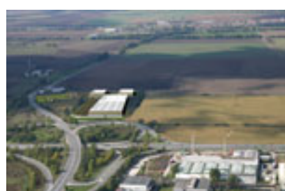
Viz. – vt. persp. 2