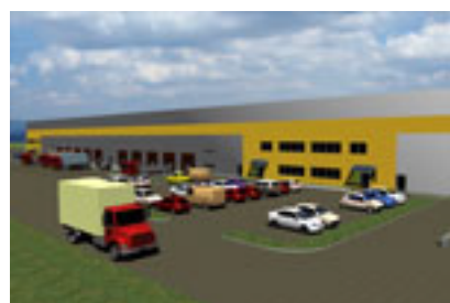
Viz. – pohľad 2