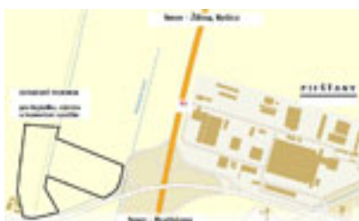
Mapa - zjazd D1