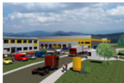
Viz. – pohľad 1

v tejto cene je obsiahnuté aj stavebné povolenie na inžinierske siete a dopravné napojenie k hranici pozemku