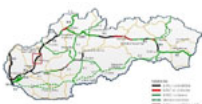
Mapa – SR