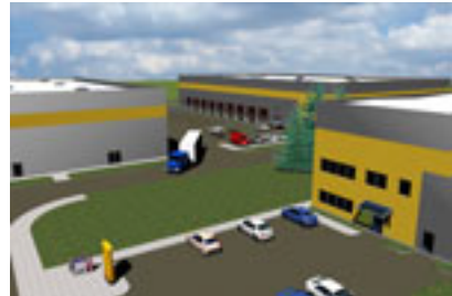
Viz. – pohľad 3