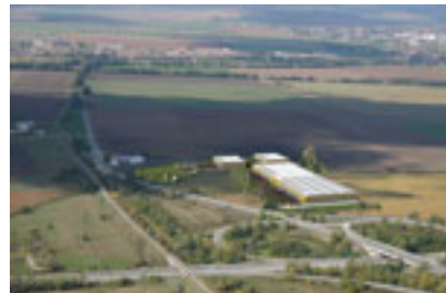
Viz. – vt. persp. 1